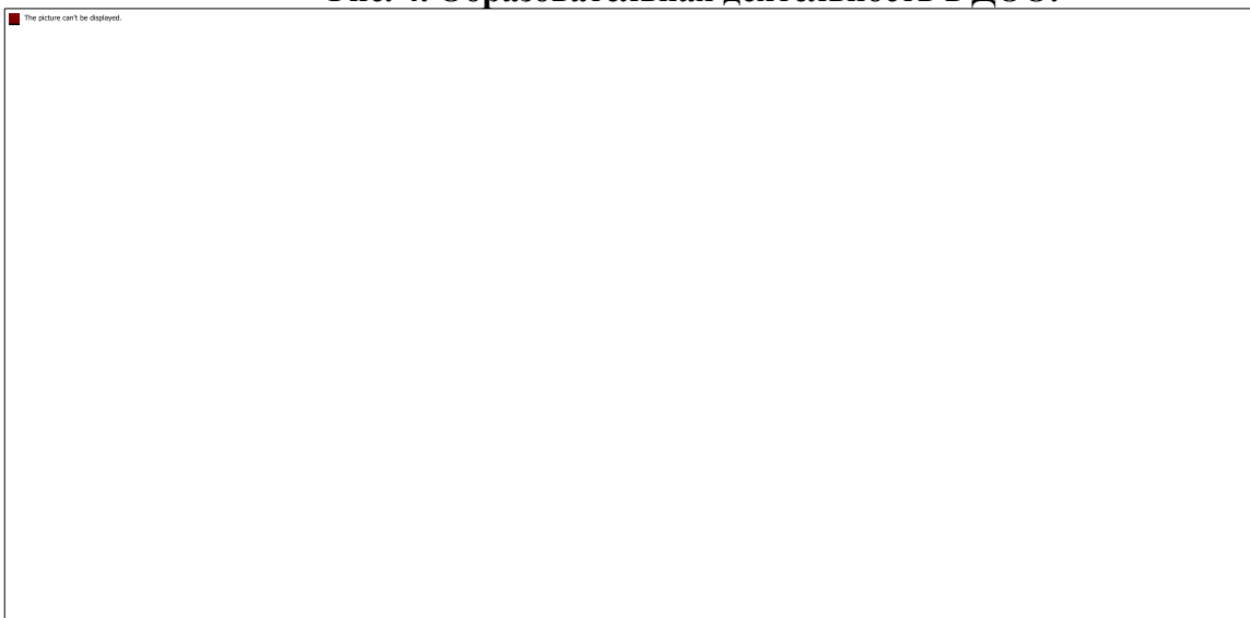
Рис. 4. Образовательная деятельность в ДОО.

Образовательная деятельность организуется как совместная деятельность педагога и детей, самостоятельная деятельность детей. В зависимости от решаемых образовательных задач, желаний детей, их образовательных потребностей, педагог выбирает один или несколько вариантов совместной деятельности: